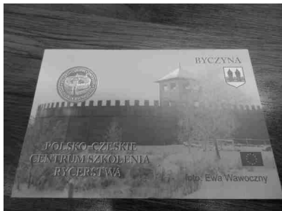
Fot. 1a. Przykładowy wzór widokówki z „suchą” pieczęcią (widok z przodu).