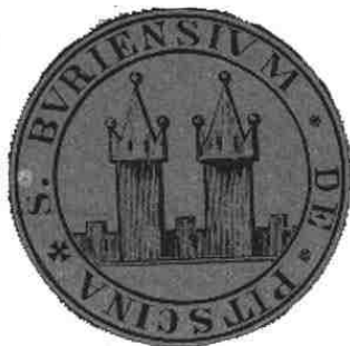
Fot. 2. Historyczna pieczęć gminy